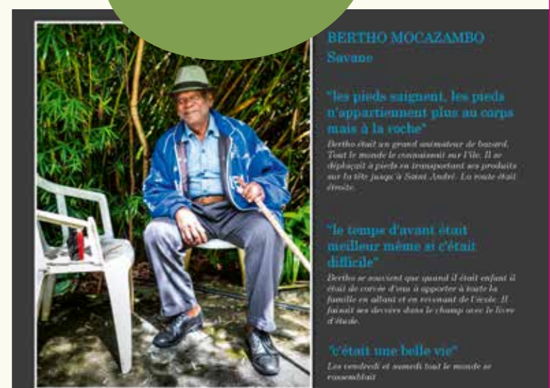
Extrait de l'exposition des Portraits de la Route de Salazie

Le partage intergénérationnel, les motifs de déplacements, les modes de transport utilisés racontent une histoire qui fait sens pour la société attachée aux valeurs familiales, à la solidarité, au vivre ensemble.