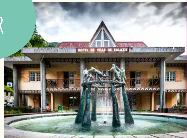
Fontaine de Salazie

L'eau, omniprésente, jaillit de toutes parts, façonne, abreuve le vivant et parfois, indomptable, crée des reliefs exceptionnels inscrits au Patrimoine mondial de l'Unesco.